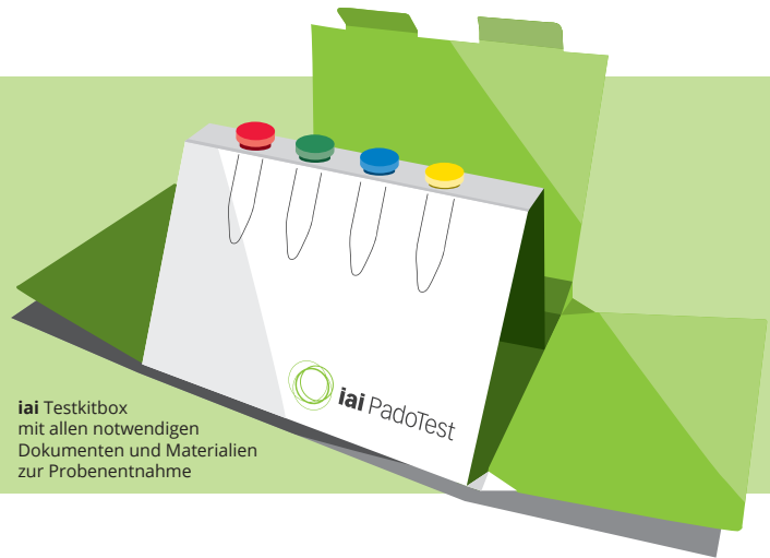
iai Testkitbox mit allen notwendigen Dokumenten und Materialien zur Probenentnahme