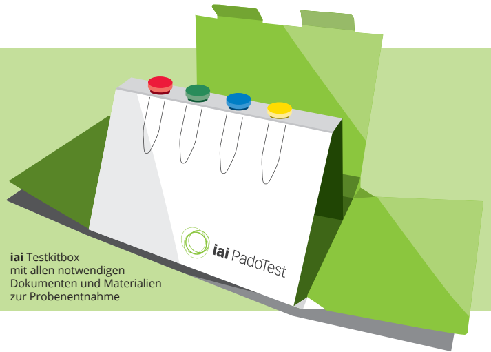
iai Testkitbox mit allen notwendigen Dokumenten und Materialien zur Probenentnahme